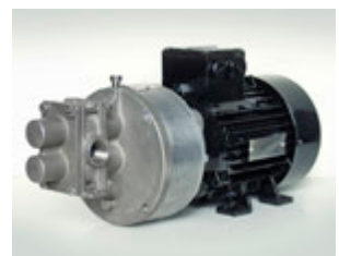
GMC2, GMC4, GMC6, GMC8, GMH6, GMH8, GM12, GM16