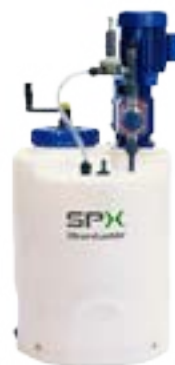
Station de dosage compacte Procam